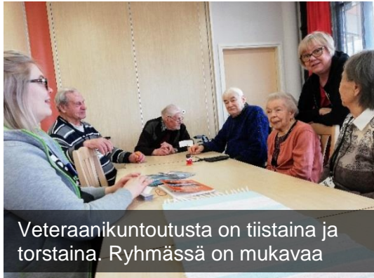
Veteraanikuntoutusta on tiistaina ja torstaina. Ryhmässä on mukavaa

-Perniössä on pihatyöt, talvella saa lämmittää takkaa ja laittaa soraa pihatielle. Aamuisin voimistelen, jos ehdin muilta töiltä.