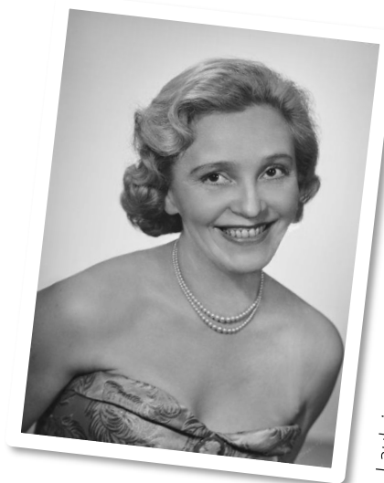
Lauluja Ansa Ikonen levyiltä ja elokuvista 23.5. klo 14.30