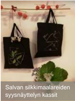
Salvan siikkimaalareiden syysnäyttelyn kassit

Iloalsalossa on vapaita asuntoja palvelutalossa , samoin lyhytaikaispaikkoja vuokrattavaksi. Jos olet miettinyt muuttoa palvelutaloon, nyt on hyvä hetki toimia. Vuokrattavana on kaiken aikaa muutamia asuntoja, kooltaan 40-55 m 2 . Myynnissä ei tällä hetkellä ole yhtään. Sovi tutustumiskäynti tai tule Iloalsalo tutuksi -päivään. Kannattaa tulla tutustumaan! Tai vaikka jouluksi lomalle kalustettuun lyhytaikaisasuntoon, täysihoittoon.