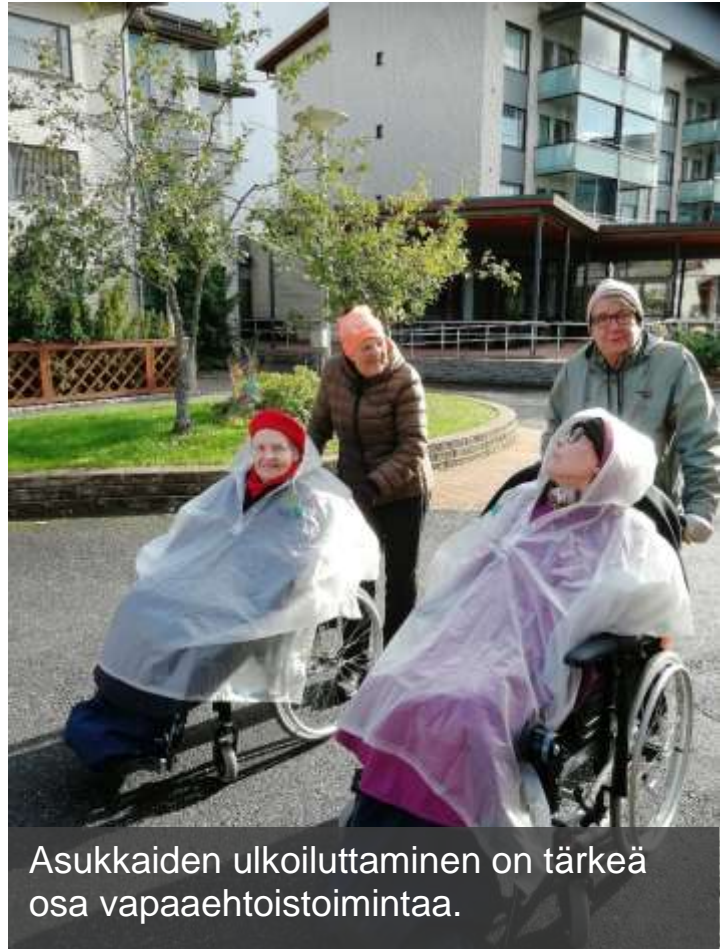
Asukkaiden ulkoiluttaminen on tärkeä osa vapaaehtoistoimintaa.

*Vuosi 2020 oli poikkeuksellinen toiminnaltaan, joutuimme rajaamaan tapahtumiamme turvallisuuden vuoksi.